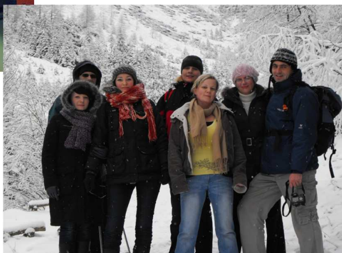
Po godzinach... Wyjazd integracyjny, Zakopane 2009