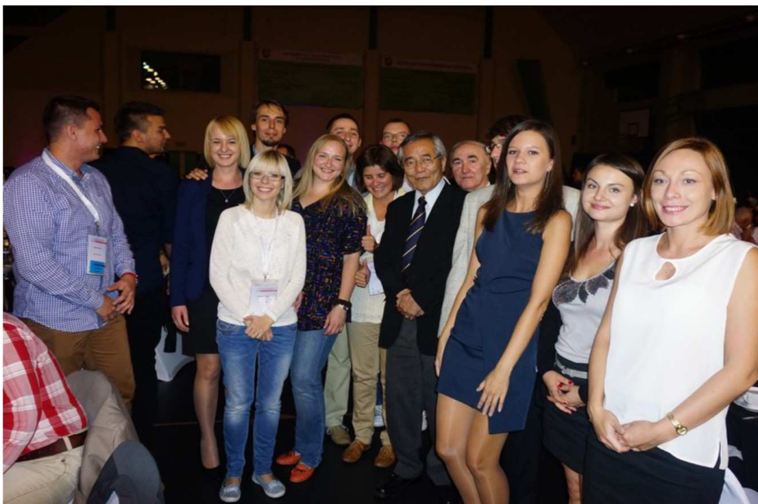
Spotkanie doktorantów z Laureatem Nagrody Nobla Profesorem Ei-ichi Negishi honorowym gościem 57 Zjazdu PTChem w Częstochowie (2014 r.)