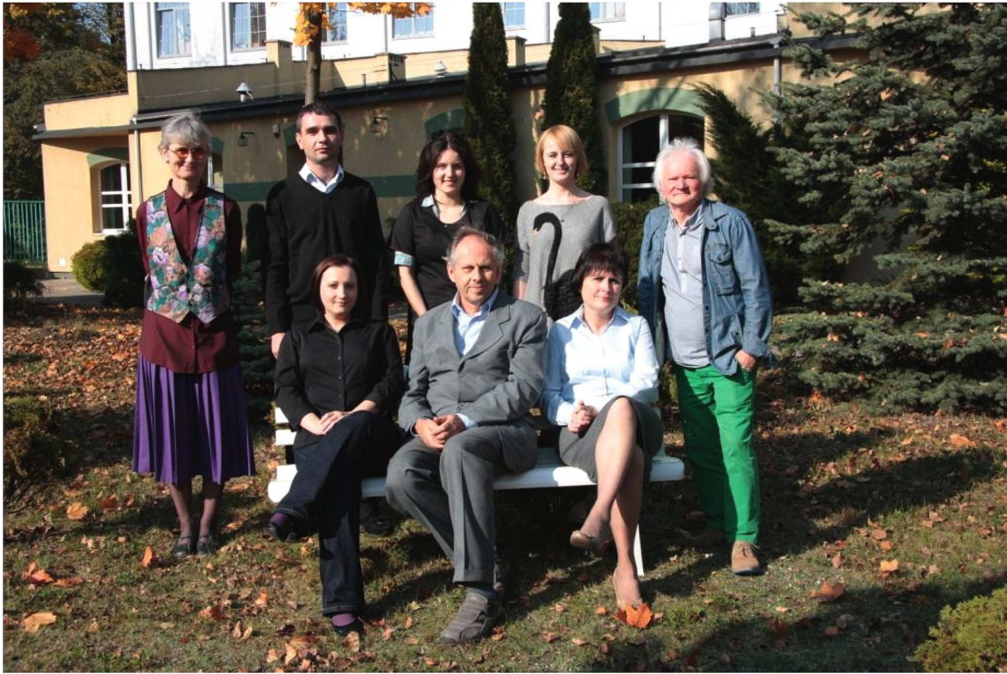
Zakład Analizy Instrumentalnej, 2013