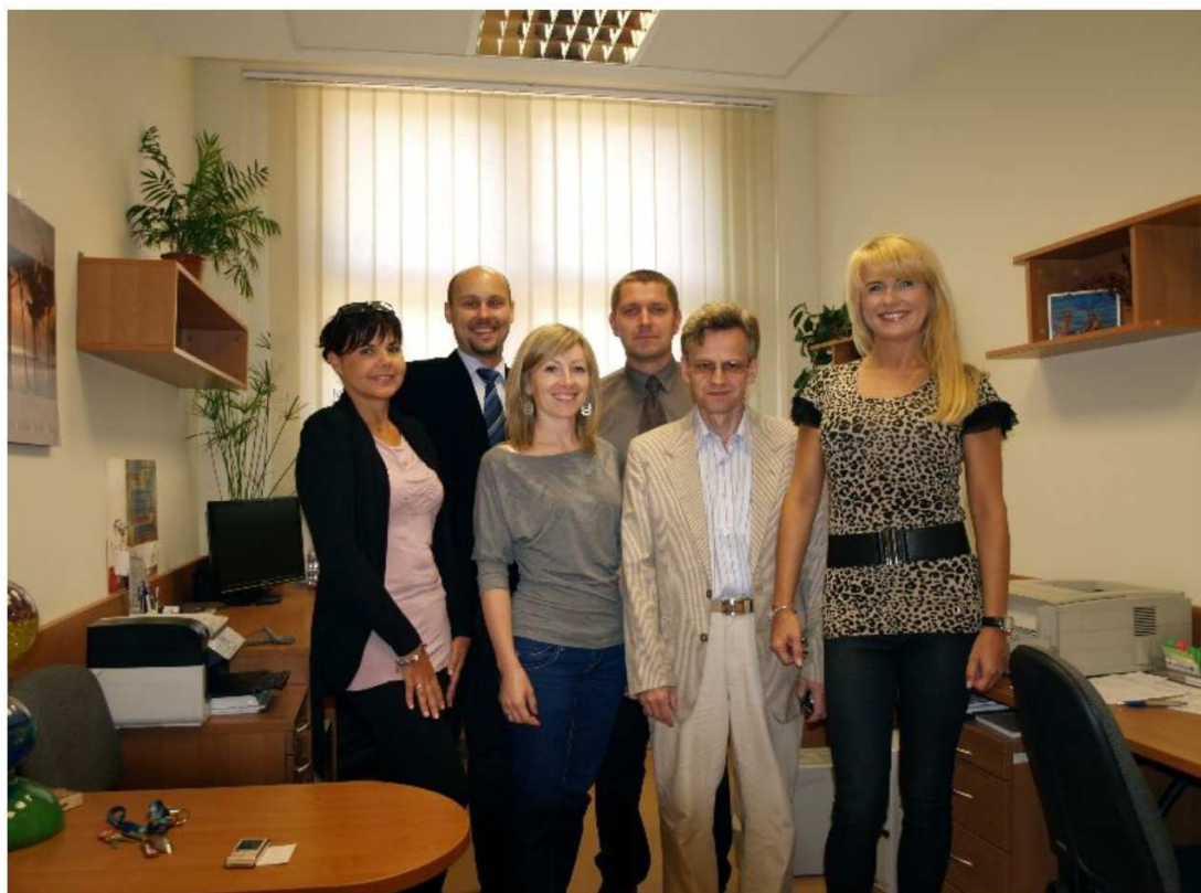
Zespół Pracowni Zagrożeń Środowiska