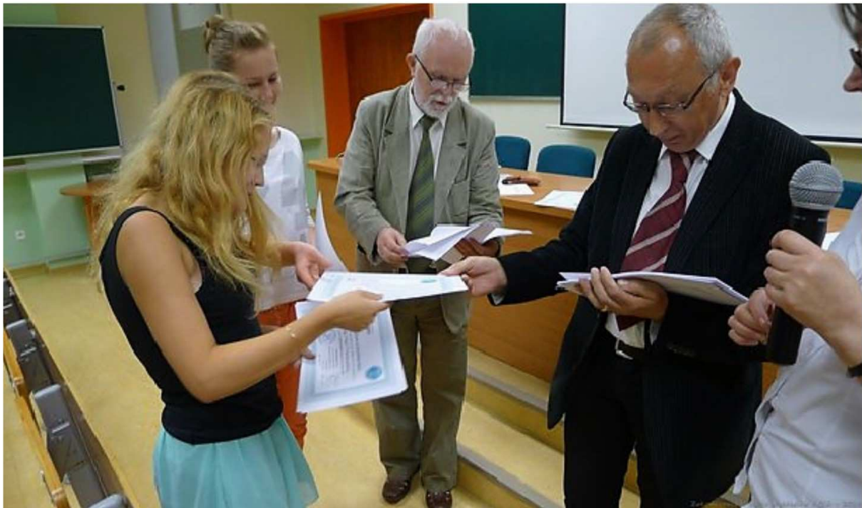
Zakończenie V cyklu wykładów ACCh, 2014