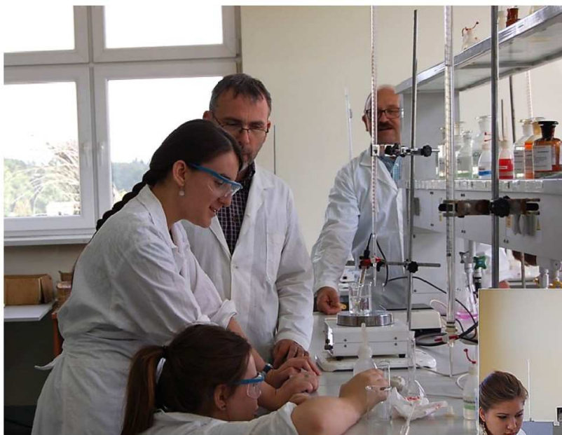
Zajęcia młodzieży szkół średnich w ramach programu Uniwersytet Zawsze Otwarty UZO