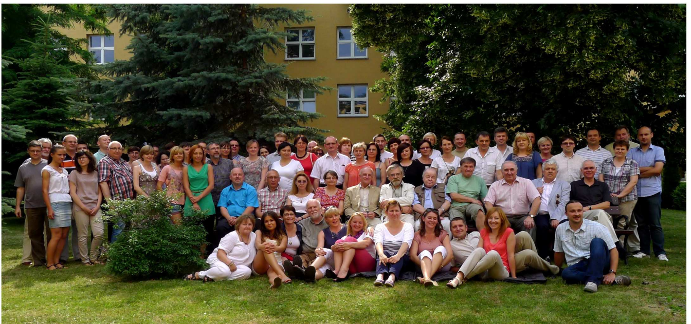
V Rocznicą powstania Wydziału Chemii (2013 r.)