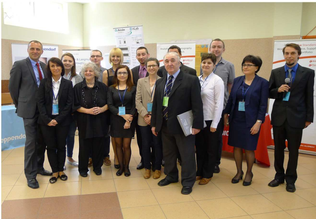
Spotkanie doktorantów z Laureatką Nagrody Nobla Profesor Ada Yonath honorowym gościem III Łódzkiego Sympozjum Doktorantów Chemii (2015 r.)