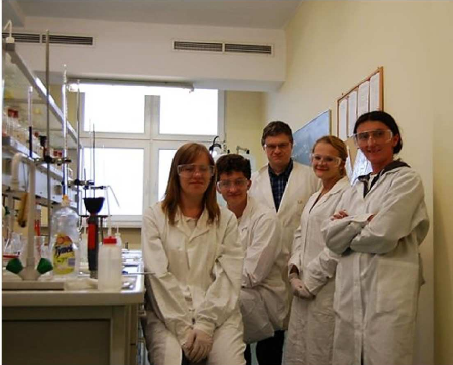
Warsztaty ACCh - 2014