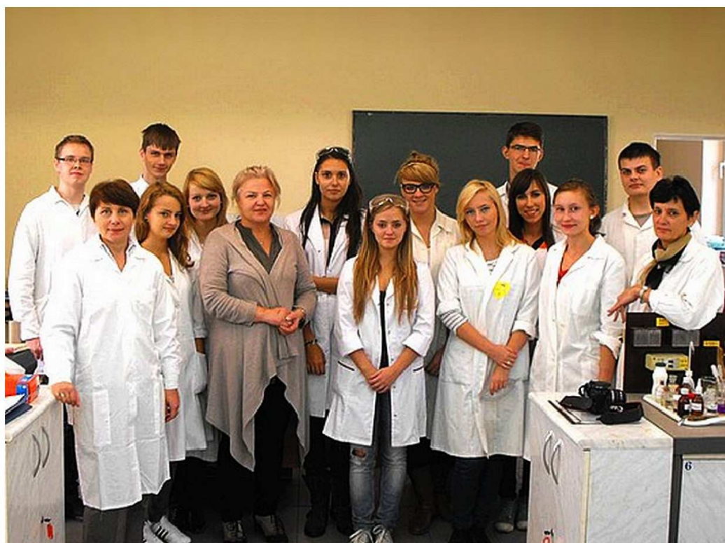
Warsztaty Chemiczne dla maturzystów, 2012