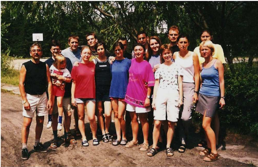
Jeruzal 2001 r.