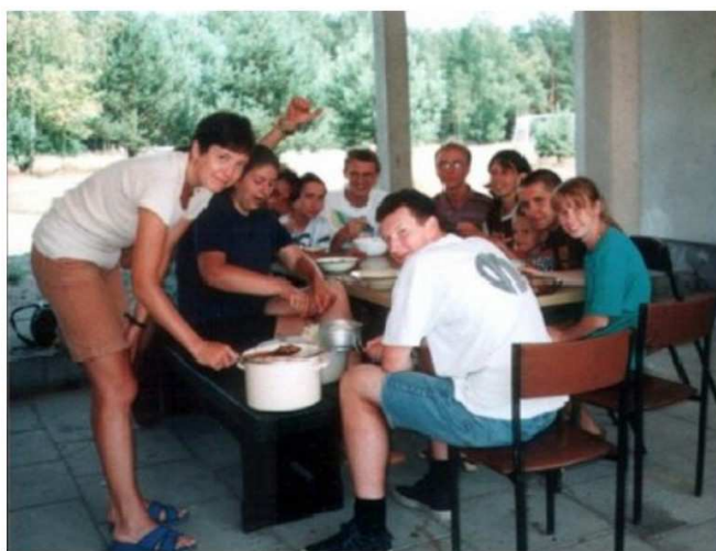
Wspólne przygotowywanie posiłku, Załącze 1999