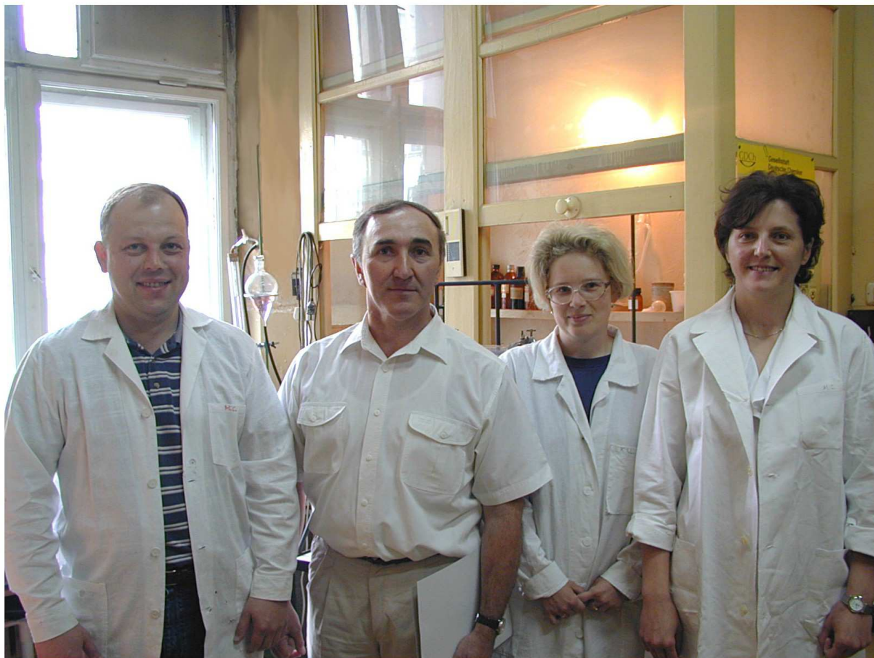
Silna grupa Profesora Mlostonia