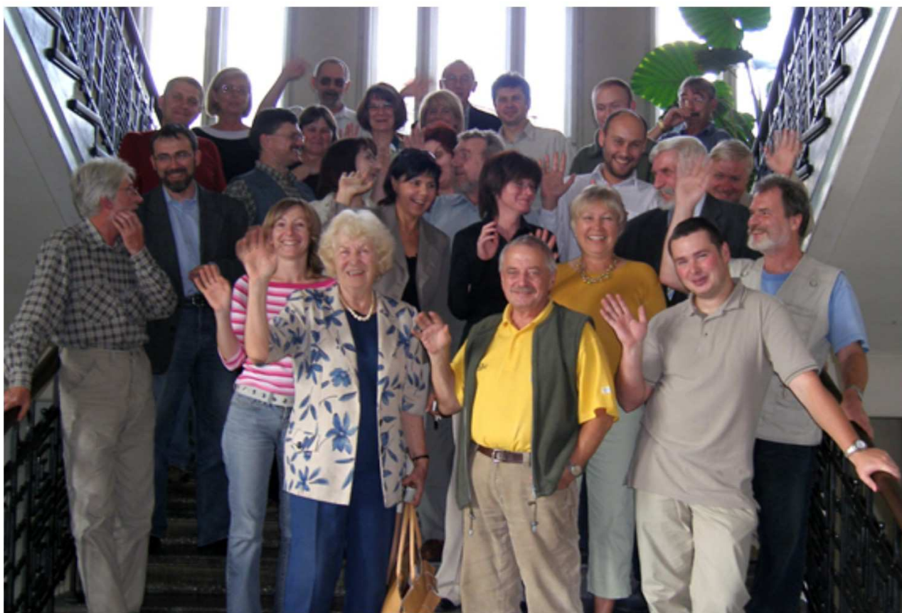
Katedra Chemii Ogólnej i Nieorganicznej 2003 r.