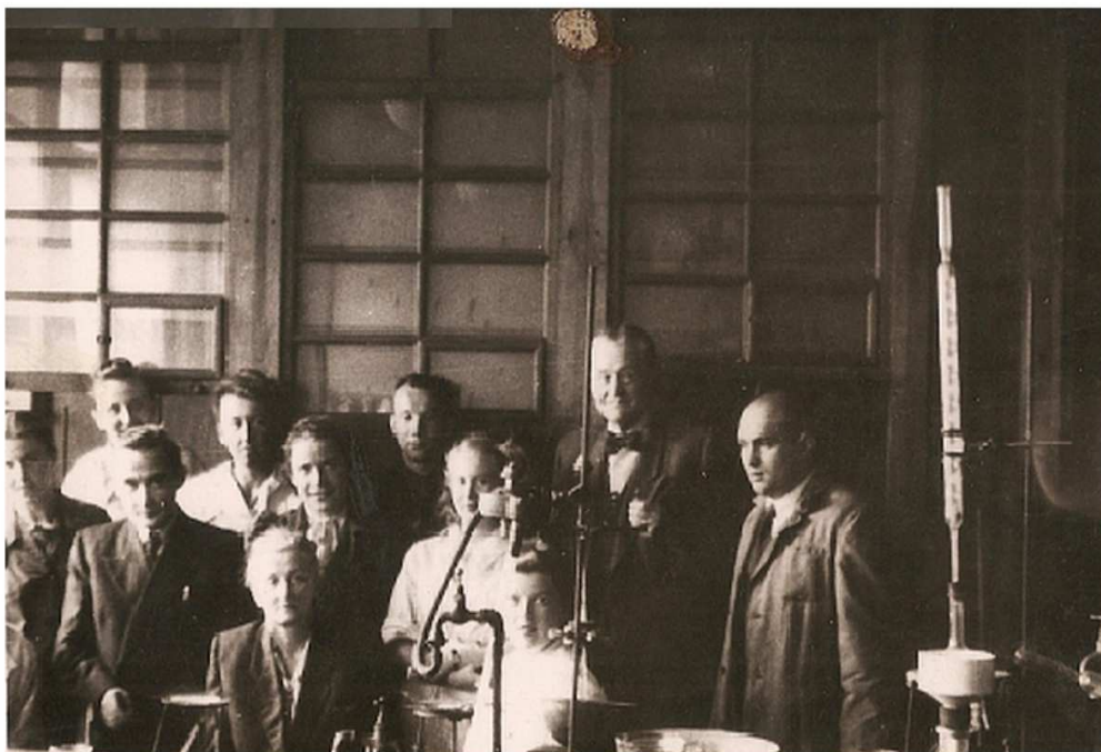
Pracownia Chemii Organicznej – 1952 r.