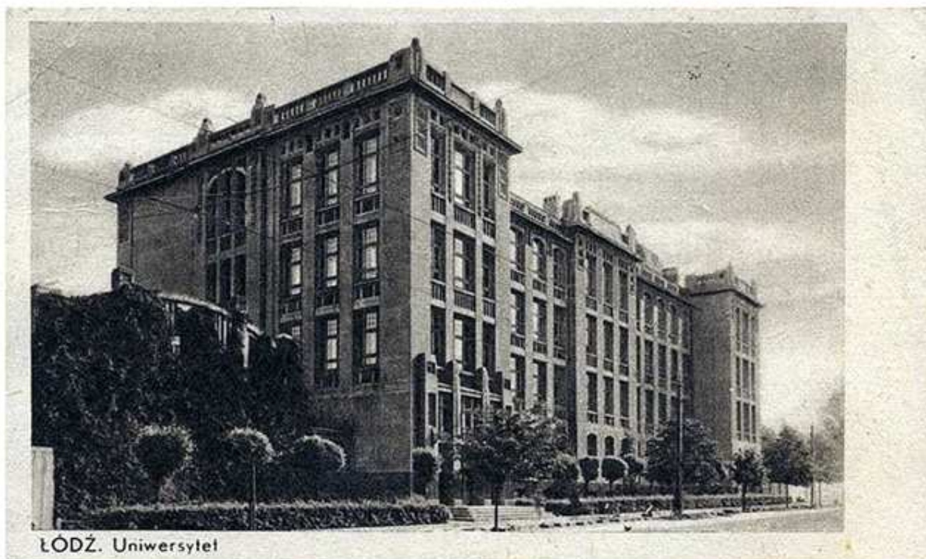
Budynek Uniwersytetu Łódzkiego - Wydział Matematyczna Przyrodniczy – Kierunek Chemii – 1949