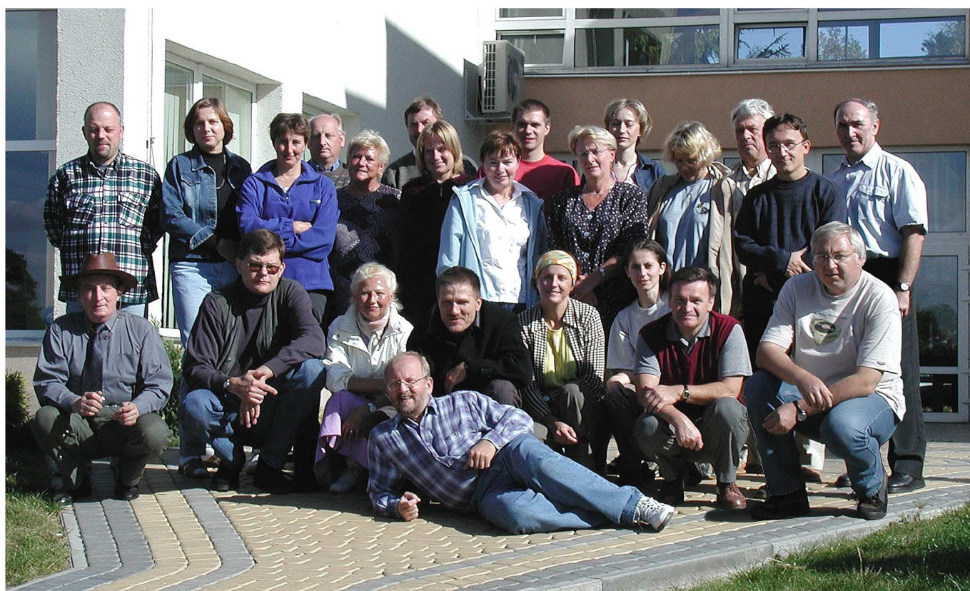
Smardzewice 2003 r.